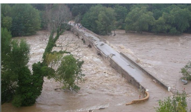
Le gué sur la Thève à Coye-la-forêt