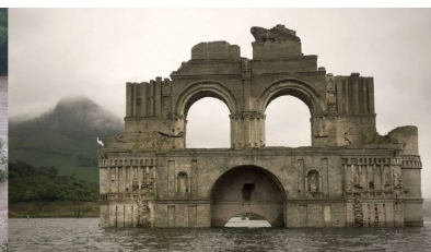
Le château de Chantilly

Le 11 mars, les Baskets de Seugy furent nombreux à participer au 10 km et semi marathon de St Witz . Une photo des courses tout de même :